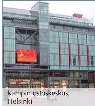
Kampin ostoskeskus, Helsinki