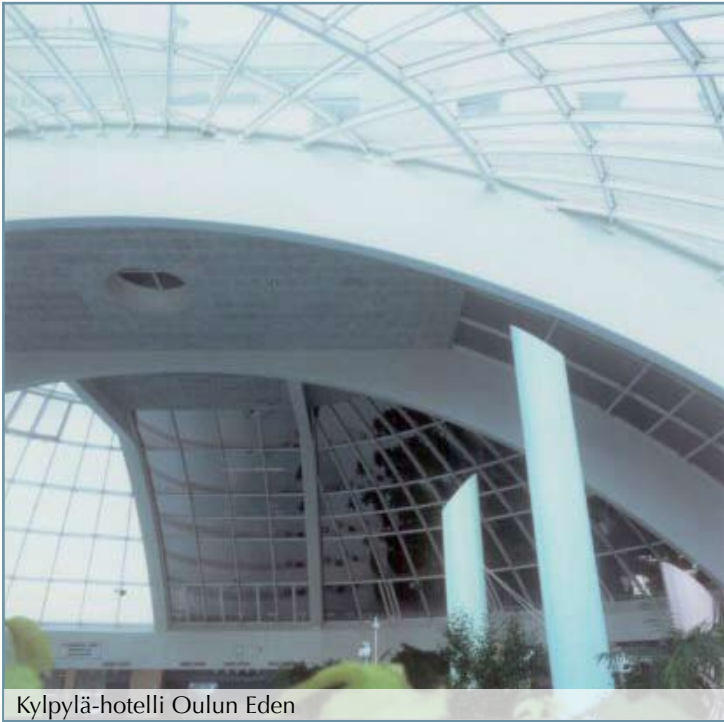
Kylpylä-hotelli Oulun Eden

Sah-Ko Oumet on erikoistunut metallisten julkisivurakenteiden valmistamiseen. Toimitamme ja asennamme metallirakenteiset lasikatteet, ovet, ikkunat ja lasipalo-ovet koko Suomen alueella. Toimitamme valmiit kokonaisuudet keskisuurista projekteista aina suuriin valtakunnallisestikin merkittäviin rakennushankkeisiin kuten esim. kauppakeskukset, kylpylät, lentoasemat jne. Asiakkainamme ovat pääsääntöisesti rakennusliikkeet ja kuntayhtymät. Asiakkaamme arvostavat yhteistyösuhteessamme luotettavuutta, joustavuutta sekä ajallaan tehtäviä nopeita toimituksia.