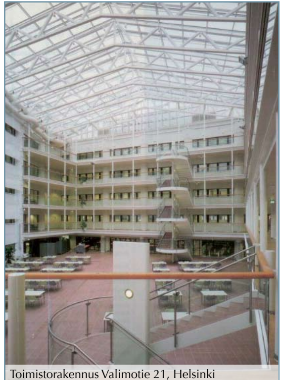
Toimistorakennus Valimotie 21, Helsinki