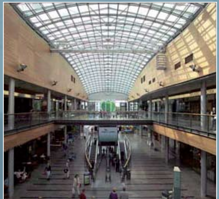
Kauppakeskus Iso Omena, Espoo